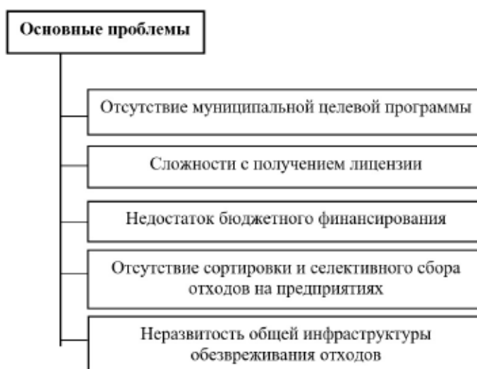
Рис. 1. Основные проблемы на уровне муниципального образования

классов опасности. Все коммерческие организации, осуществляющие деятельность в области обращения с отходами, обязаны представлять в Управление городского хозяйства администрации г. Коврова статистическую отчетность об образовании, использовании, обезвреживании, транспортировании и размещении отходов производства и потребления. Выделим основные проблемы на уровне муниципального образования (рис. 1).