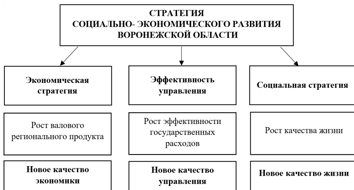
Рисунок 2 Стратегические приоритеты развития Воронежской области

масштабного привлечения капитала и системной модернизации экономики, социальная - обеспечение роста благосостояния и качества жизни населения путем реализации комплексных межведомственных программ социального развития за счет роста доходов регионального бюджета, развития социального партнерства с бизнесом, активного участия в федеральных программах. Посредством социально-экономического развития Воронежской области планируется увеличить и эффективность государственной власти, что должно выразиться во внедрении новых технологий стандартизации качества государственных услуг, исполнения решений, повышения контроля в сфере государственного управления.