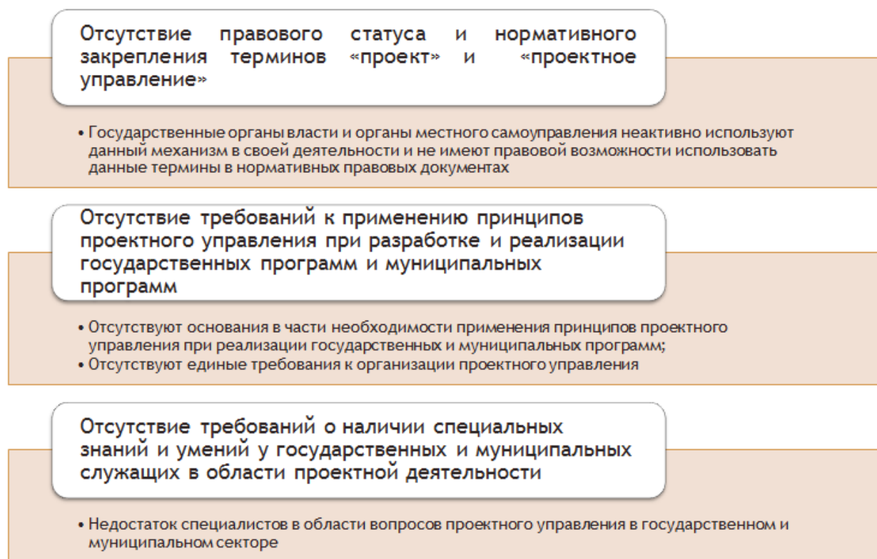
Рисунок 2. Основные пробелы и недостатки в нормативно-правовых актах, препятствующие внедрению проектного управления

Таким образом, с учетом выше изложенного, возникает необходимость в изменении следующих нормативно-правовых и подзаконных актов [8-11]: