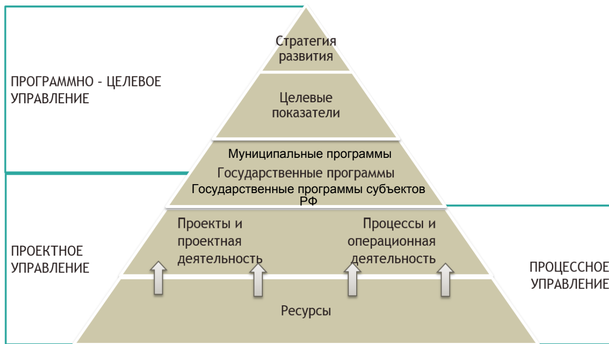
Рисунок 3. Роль и место проектного управления в стратегическом планировании

– Приказ Министерства экономического развития Российской Федерации от 20.11.2013 № 690 «Об утверждении методических указаний по разработке и реализации государственных программ Российской Федерации»