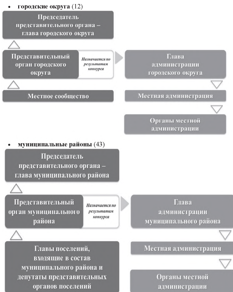
Рис. 11. Системы муниципального управления Ростовской области 1

Основной проблемой является — двухглавие муниципальных образований: одновременное наличие главы муниципального образования и главы местной администрации («сити-менеджер»), которое усложняет выстраивание отношений по вертикали. 2