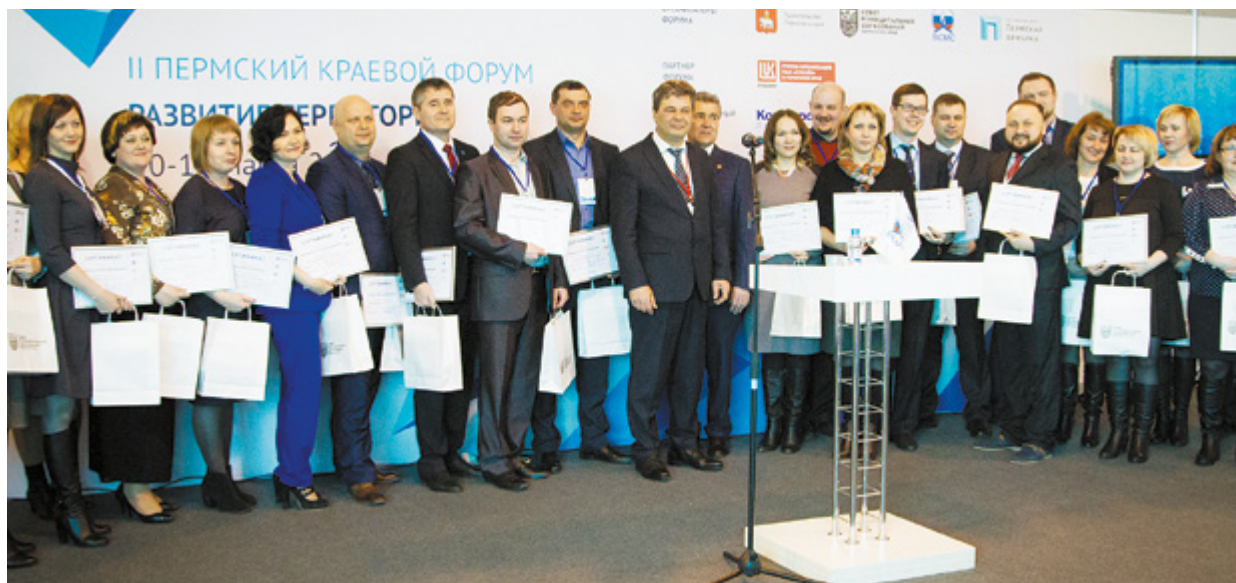
Программа «Муниципальный факультет»

Развитие способности генерировать идеи, новое осознание своих собственных возможностей в