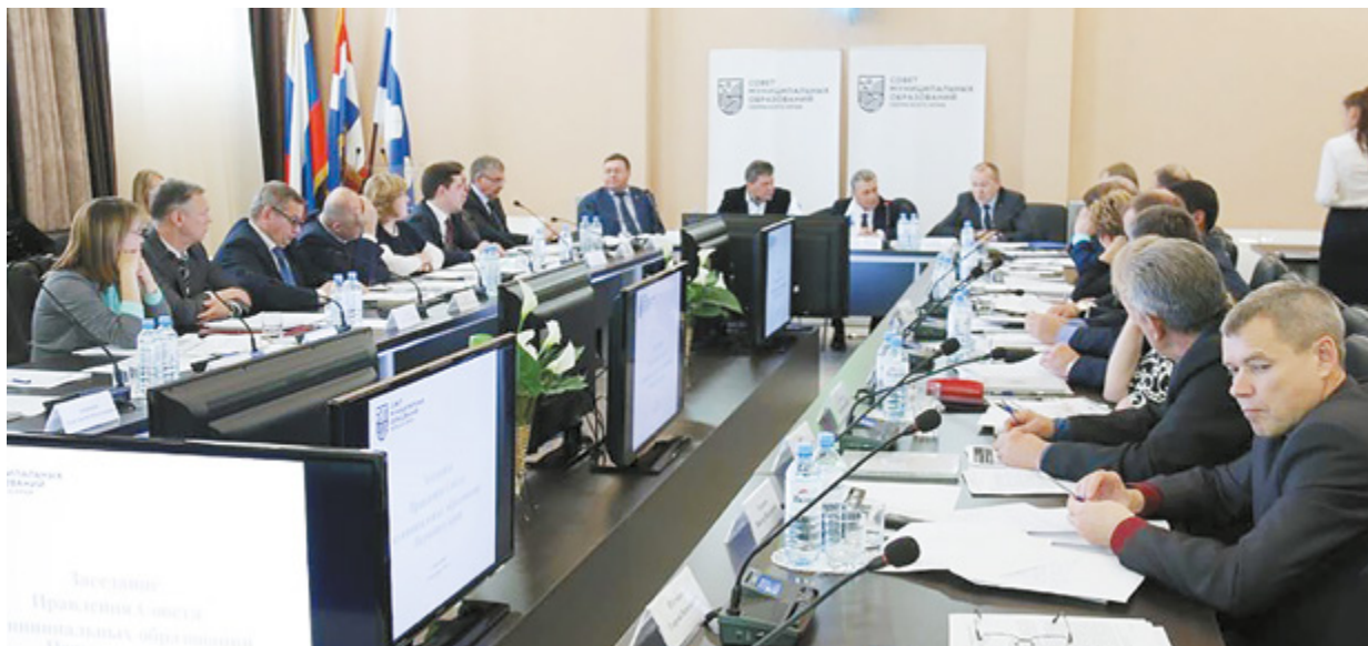
Заседание Правления Совета муниципальных образований Пермского края в Березниках

2. Березниковско-Соликамская агломерация (г. Березники, г. Соликамск, Усольский и Соликамский районы).