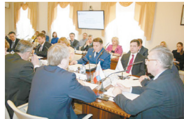
Заседание Правления Совета МО Пермского края в Перми

— О проведении открытого конкурса на разработку проекта Концепции социально-экономического развития Пермской городской агломерации.