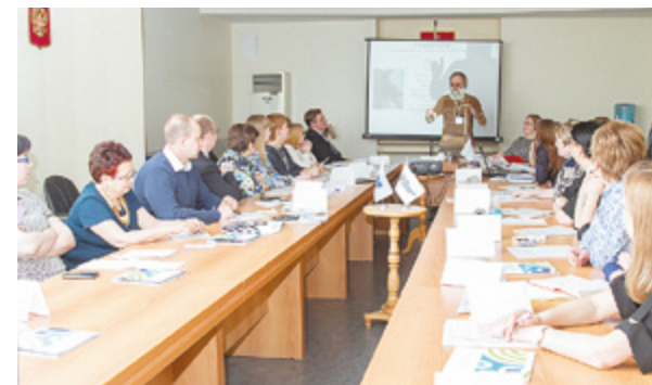
Программа «Муниципальный факультет»