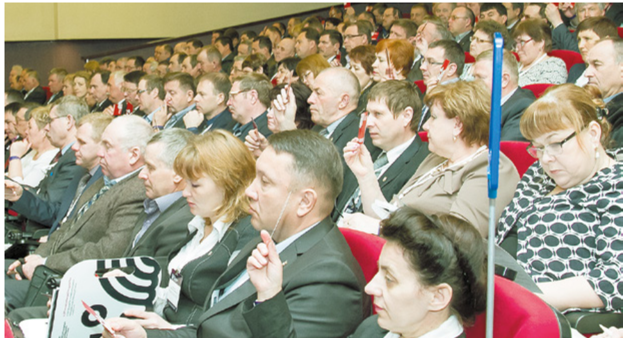
X Съезд Совета муниципальных образований Пермского края

Однако относительно первой инициативы выяснилось, что похожий, но менее радикальный законопроект «О внесении изменений в часть вторую Налогового кодекса Российской Федерации» (о переносе срока уплаты налога на имущество физических лиц, транспортного и земельного налогов с 1 декабря на 1 октября) был внесен в Государствен-