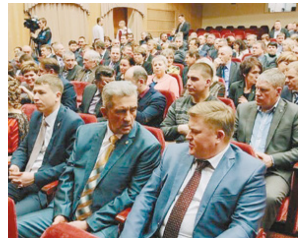
Торжественный приём Совета муниципальных образований Пермского края

Партнеры Совета из числа органов государственной власти неизменно являются почетными гостями торжественного приема Совета муниципальных образований Пермского края . По сло-