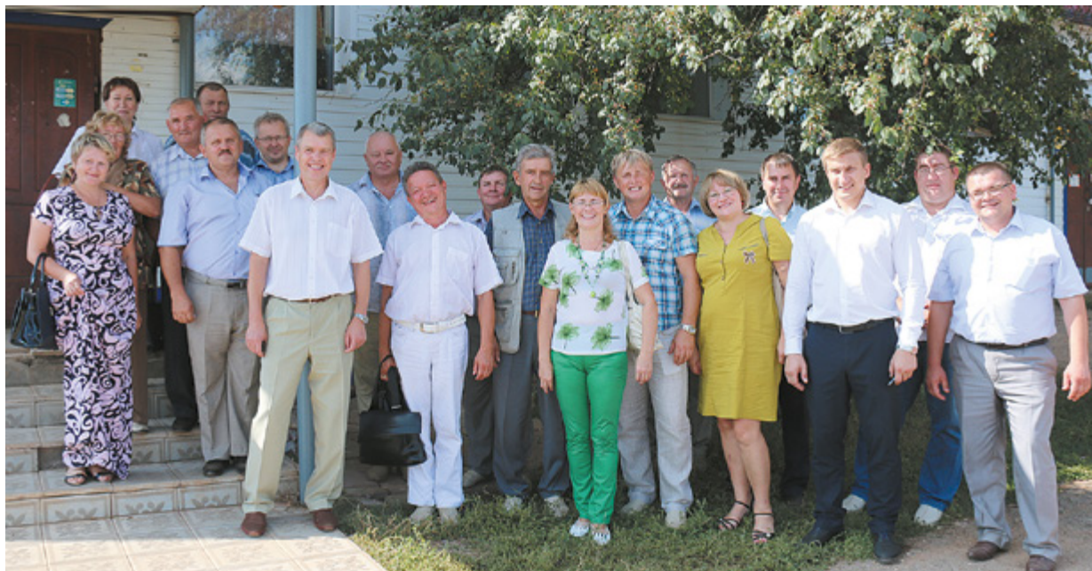
Заседание Палаты сельских поселений в Карагайском районе

– актуальные вопросы законодательства о противодействии коррупции (правление Палаты сельских поселений);