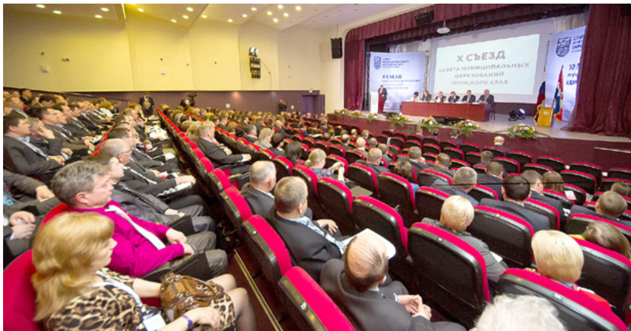
Пленарное заседание X съезда Совета муниципальных образований Пермского края

Решено оставить на контроле до 1 декабря 2016 года вопрос об увеличении финансирования мероприятий, направленных на поддержку и разви-