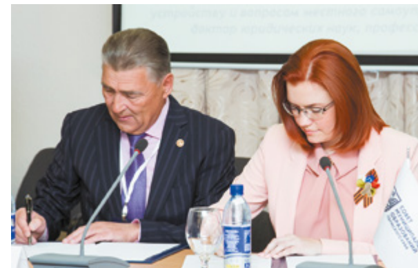
Подписание соглашения о сотрудничестве с Ассоциацией муниципальных образований Республики Крым

На Всероссийское Сопровождение исполнительных директоров советов муниципальных образований субъектов Российской Федерации, союзов и ассоциаций – членов Конгресса в г. Пермь съехались делегаты от 55-ти региональных советов муниципальных образований, а также 6-ти организаций межмуниципального сотрудничества. Благодаря содействию Совета муниципальных образований Пермского края за работой Сопровождения можно было наблюдать дистанционно – на сайте Совета была организована прямая трансляция. Участники обсудили пути развития Конгресса, основные тренды развития законодательства о местном самоуправлении, вопросы проведения Всероссийского конкурса «Лучшая муниципальная практика», подготовку региональных и федерального докладов «О состоянии местного самоуправления». Часть дискуссии была посвящена участию Конгресса и его членов в реализации Послания Президента Российской Федерации Федеральному Собранию от 01.12.2016.