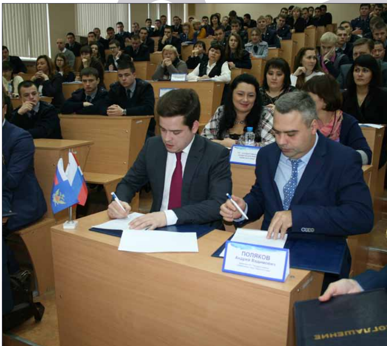
Подписание Соглашения между Советом муниципальных образований Пермского края и Государственным юридическим бюро Пермского края