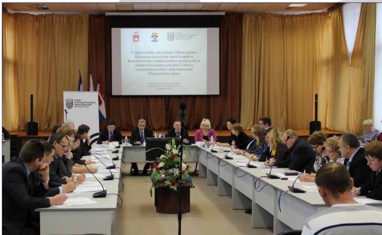
Заседание Палаты сельских поселений Совета муниципальных образований Пермского края

14. Страница Единого методологического центра размещена на сайте Министерства территориального развития Пермского края – http://minter.permkrai.ru/index/staticview/id/195/