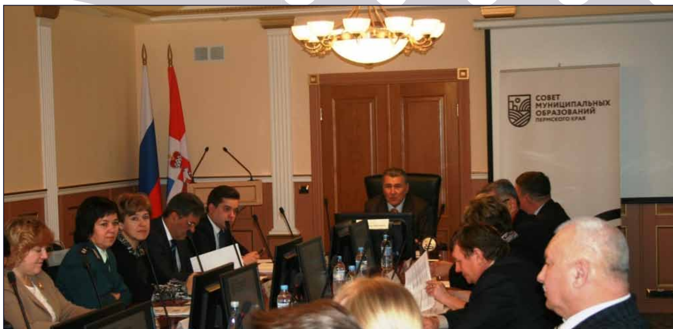
Заседание Правления Совета муниципальных образований Пермского края