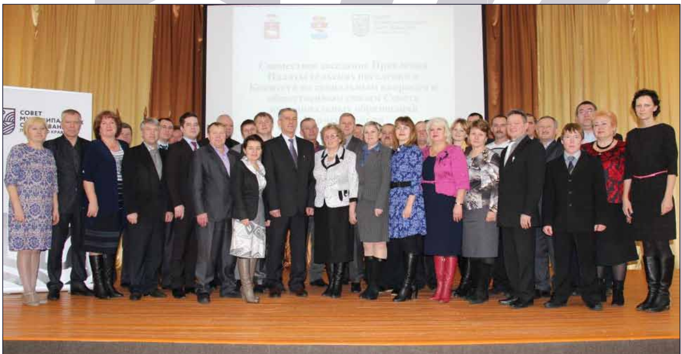
Палата сельских поселений Совета муниципальных образований Пермского края

явшемся 28 мая 2015 года. Заместитель Министра финансов России Леонид Горнин в своем докладе предложил ввести в статью 56 Федерального закона № 131-ФЗ нормы о наделении представительных органов муниципальных образований правом определять часть территории муниципального образования для проведения голосования о самообложении и применения самообложения. На том же заседании было принято решение о подготовке соответствующего законопроекта. (По материалам ИА «РБК» – http://www.rbc.ru/politics/28/05/2015/55673e119a7947e3094b3e8b ).