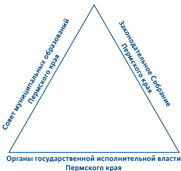
Рисунок 1. Система оперативного управления развитием местного самоуправления в Пермском крае

Совет муниципальных образований Пермского края участвует в управлении развитием местного само-