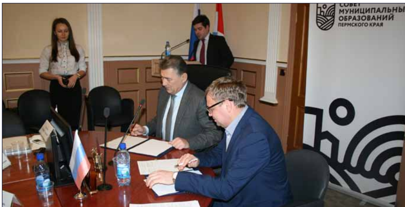
Подписание соглашения о взаимодействии между Советом муниципальных образований Пермского края и Территориальным Фондом общего медицинского страхования Пермского края