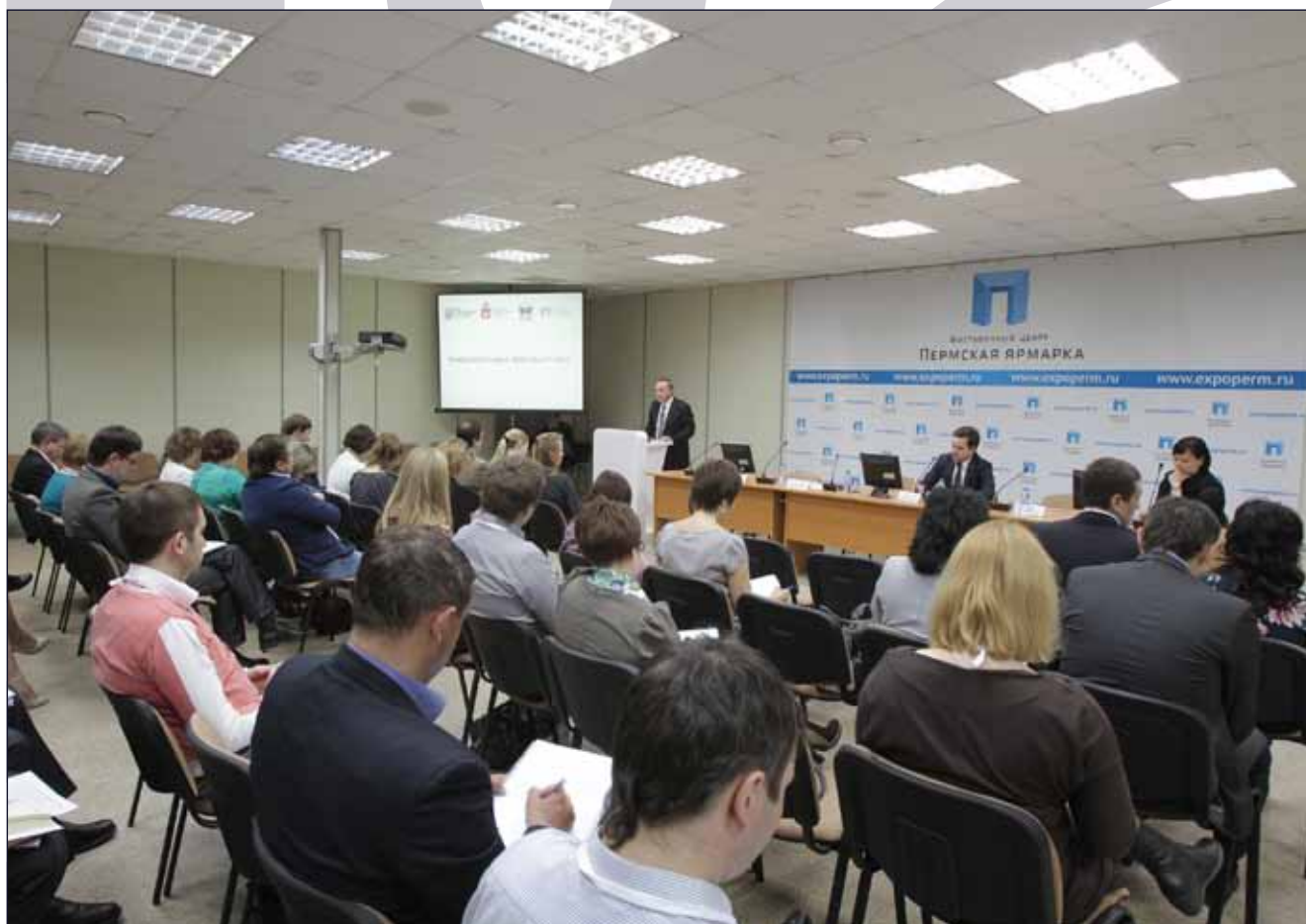
Семинар в рамках программы Совета муниципальных образований Пермского края «Муниципальный факультет-2015»

17. Кластеры, состоящие из малых и средних предприятий, могут инвестировать средства в необходимую для себя инфраструктуру или создание новых производств. Пример – сельхозкооператив, который строит пункты хранения и предприятия по переработке и упаковке своей продукции. Перспективной формой инвестиций для сельхозкооператива также является закупка для своих действующих и потенциальных членов молодняка животных и птиц или семян сельхозкультур. С гражданами и собственниками личных (подсобных) хозяйств, получившими такую помощь, заключается договор, где прописаны обязательства вернуть вложенные средства приплодом или частью урожая, которые по решению кооператива вновь распространяются или же сдаются на переработку.