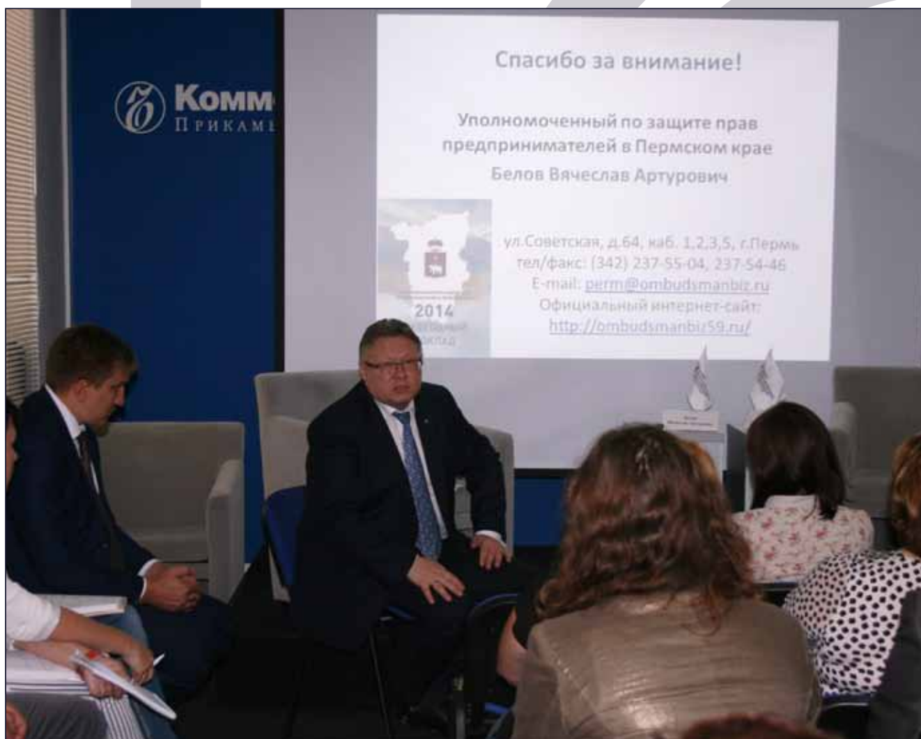
Семинар в рамках программы Совета муниципальных образований Пермского края «Муниципальный факультет-2015»

го муниципального района. 15 октября 2015 года район признан победителем окружного этапа конкурса муниципальных практик по улучшению предпринимательского климата в рамках ежегодной премии «Бизнес-Успех» [1]. 20 января 2016 года Краснокамский район выиграл финал конкурса (всего участвовали 10 муниципалитетов) и получил главный приз – 1 миллион рублей.