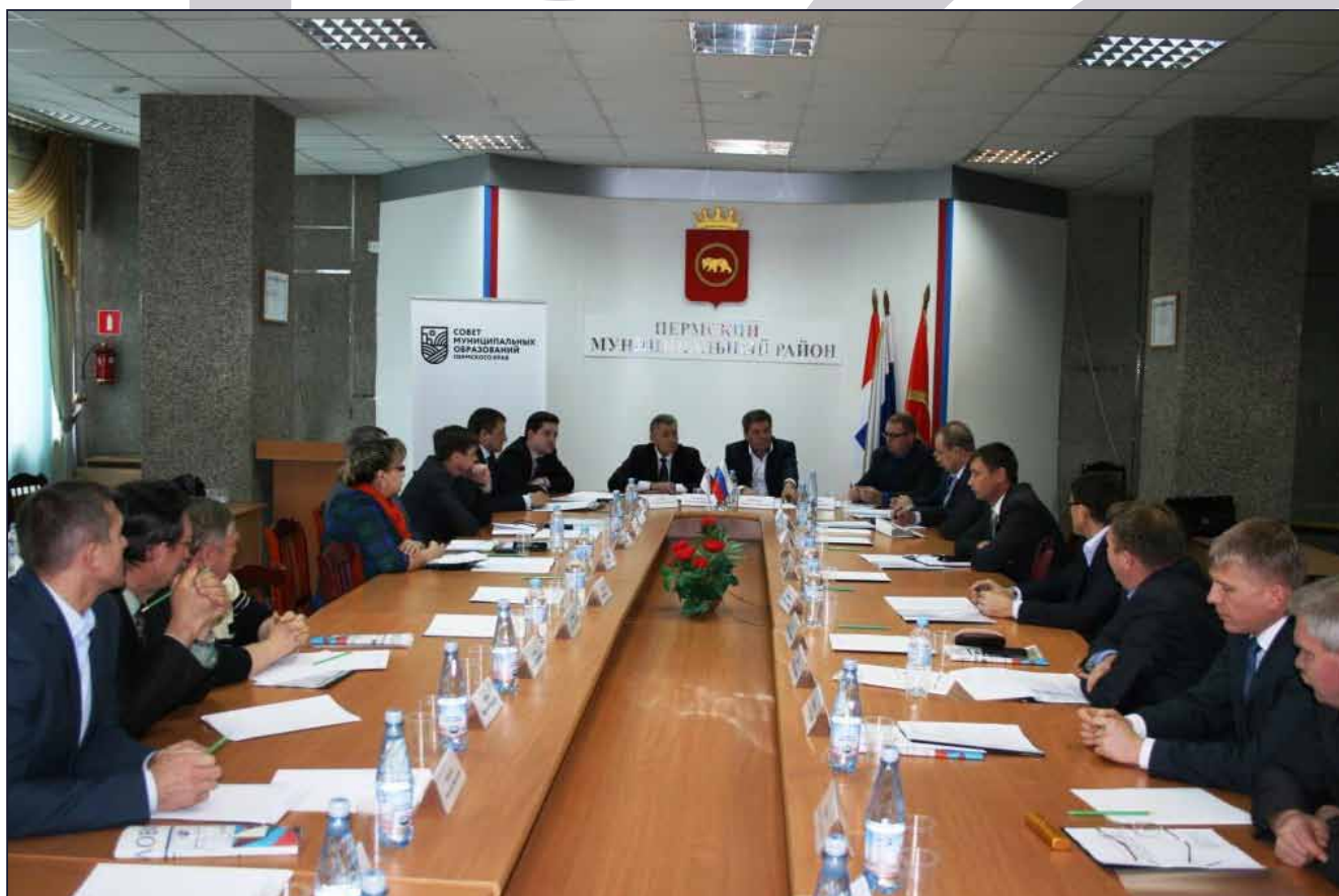
Заседание Палаты городских поселений Совета муниципальных образований Пермского края

8. В соответствии с Соглашением между Министерством сельского хозяйства Российской Федерации и Министерством сельского хозяйства и продовольствия Пермского края № 115/10-С от 29 марта 2016 г.