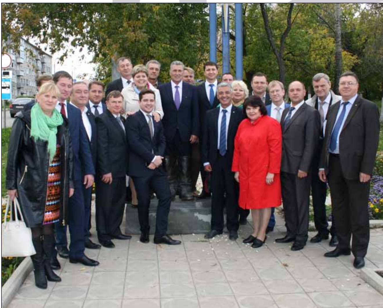
Выездное заседание Правления Совета муниципальных образований Пермского края в ЗАТО Звездный

1. В соответствии с Приложением 19 к закону Пермского края № 414-ПК от 22 декабря 2014 г. «О бюджете Пермского края на 2015 год и на плановый период 2016 и 2017 год».