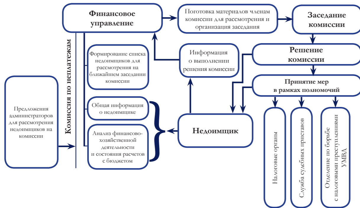
СХЕМА РАБОТЫ КОМИССИИ ПО НЕПЛАТЕЖАМ В ГОРОДЕ БРЯНСКЕ

2014–2015 гг. для административных центров регионов ЦФО этот показатель составляет 18–18,2 тыс. руб. на одного жителя в год.